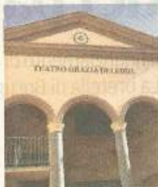
Il teatro Grazia Deledda

I titoli in cartellone sono sette e le compagnie impegnate negli spettacoli parteciperanno anche a un laboratorio d'arte permanente dal titolo "Along with art". A fare da apripista saranno gli attori di S'Arza, che il 5 ottobre alle 15:30 cureranno la dimostrazione "Dal rito al teatro. I linguaggi del carnevale barbarici-