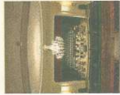
Il teatro Deledda di Paulilatino